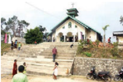
Gambar 1.1