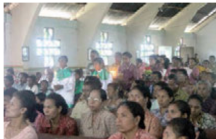
Gambar 1.2