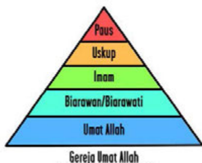
Gambar 1.3